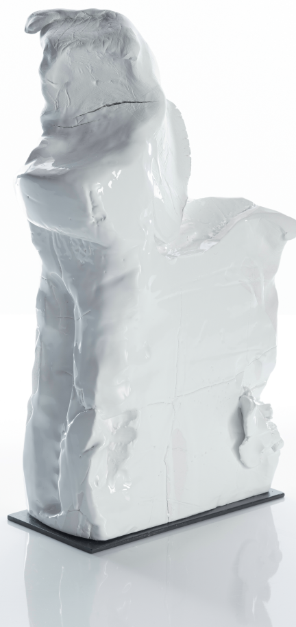
Cuerpo Desnudo 1 Serie Process 40 x 20 x 10 cm Mayólica y esmalte. Modelado

Creo que puede ser la de mejorar la calidad de la oferta actual con diseños y acabados nuevos y vanguardistas, aportando un valor añadido a las piezas de uso cotidiano que son las que se disfrutan día a día. La cerámica viva es la que usa y se toca, la cerámica no ha nacido para estar en una vitrina, ha formado parte de nuestra evolución como especie y creo que se nos ha olvidado.